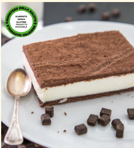
FETTA AL LATTE