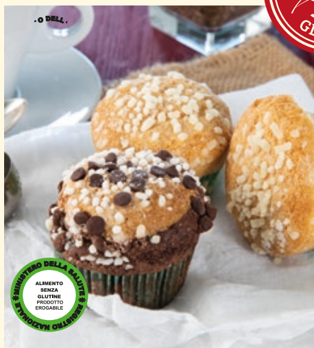
MUFFIN, MUFFIN BIGUSTO